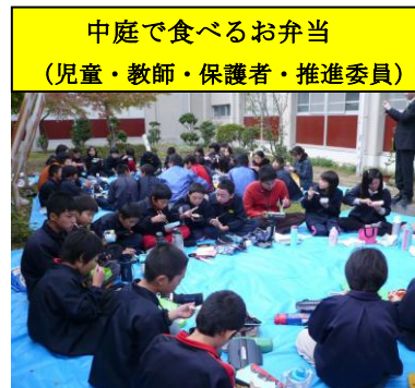
中庭で食べるお弁当 （児童・教師・保護者・推進委員）

「食」の大切さを学習するために、子どもたちが自分のお弁当を手作りして学校に持参して食べることを通して、東播磨地域教育推進委員の方々と共に、食に関する学習活動を行うものです。