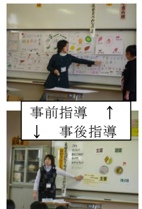
事前指導 ↑ ↓ 事後指導