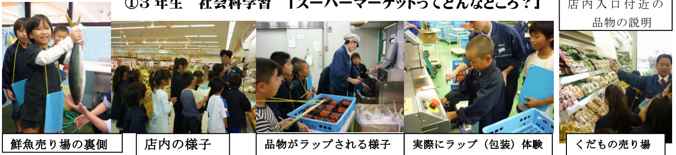
店内入口付近の 品物の説明