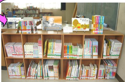
4月以降このように展示されます