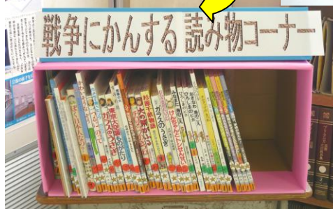
寄贈図書（図書室内で読めます）

また、「ベルマーク整理作業」で購入していただいた、「ソフトバレーボール等」を買っていただきましたので、併せてご披露させていただきます。（上記参照）