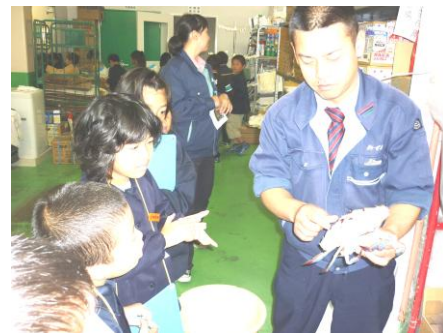
3年生 社会科 校外学習 スーパーマーケット「マルアイ」