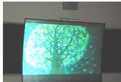
3・4年生映像と効果音を使って 「モチモチの木」