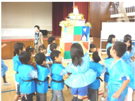
2年生 保・幼・小連携 「おまつり集会」