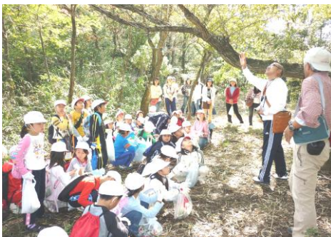
3年生 環境体験学習 「一本松山一里山の環境」