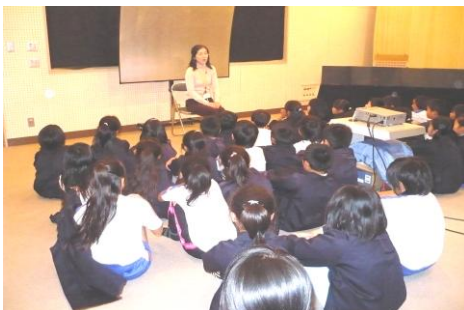
3・4年生お話トムテ「お話し会」 「三ねんねたろう」